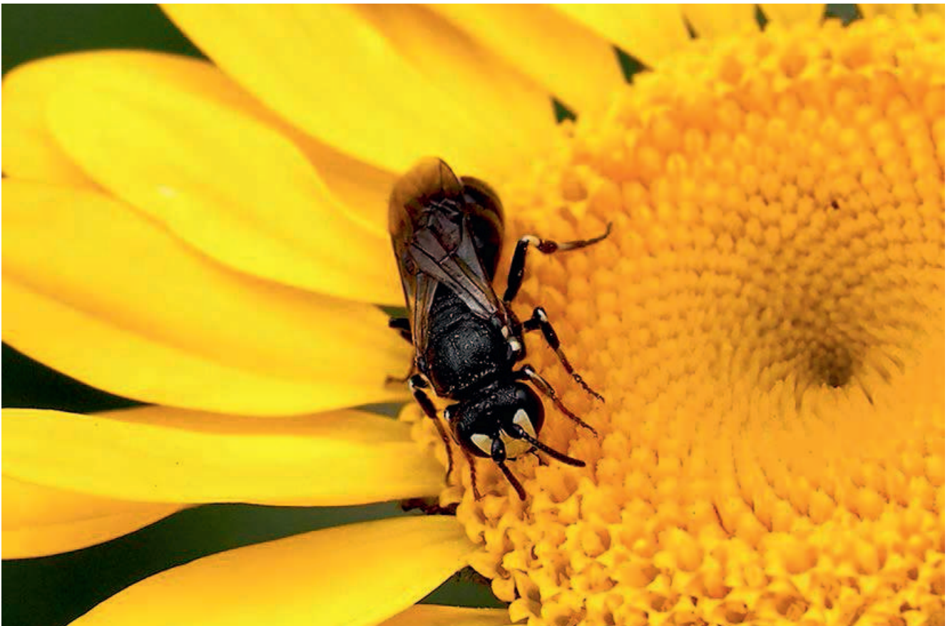
Rainfarn-Maskenbiene ( Hylaeus nigrinus )

Nur wenige Tierarten verbringen ihren gesamten Lebenszyklus in den Holzhaufen, sondern sie nutzen diese Kleinstrukturen nur während einer bestimmten Zeit bzw. einem bestimmten Lebensabschnitt. Aus diesem Grund werden Holzhaufen auch als Trittsteinbiotope bezeichnet. Zur Anlage entlang von Straßen eignen sich besonders gut besonnte und windgeschützte Standorte mit ausreichendem Fahrbahnabstand wie z. B. weitläufige Straßenböschungen vor Waldrändern und Gebüsch. Da der Zersetzungsprozess der Holzhaufen einen Nährstoffeintrag in der Umgebung zur Folge haben kann, sollte von einer Anlage auf sensiblen, nährstoffarmen Standorten – wie etwa Magerwiesen – abgesehen werden. Hier sollten und stattdessen Steinhäufen oder -wälle errichtet werden.