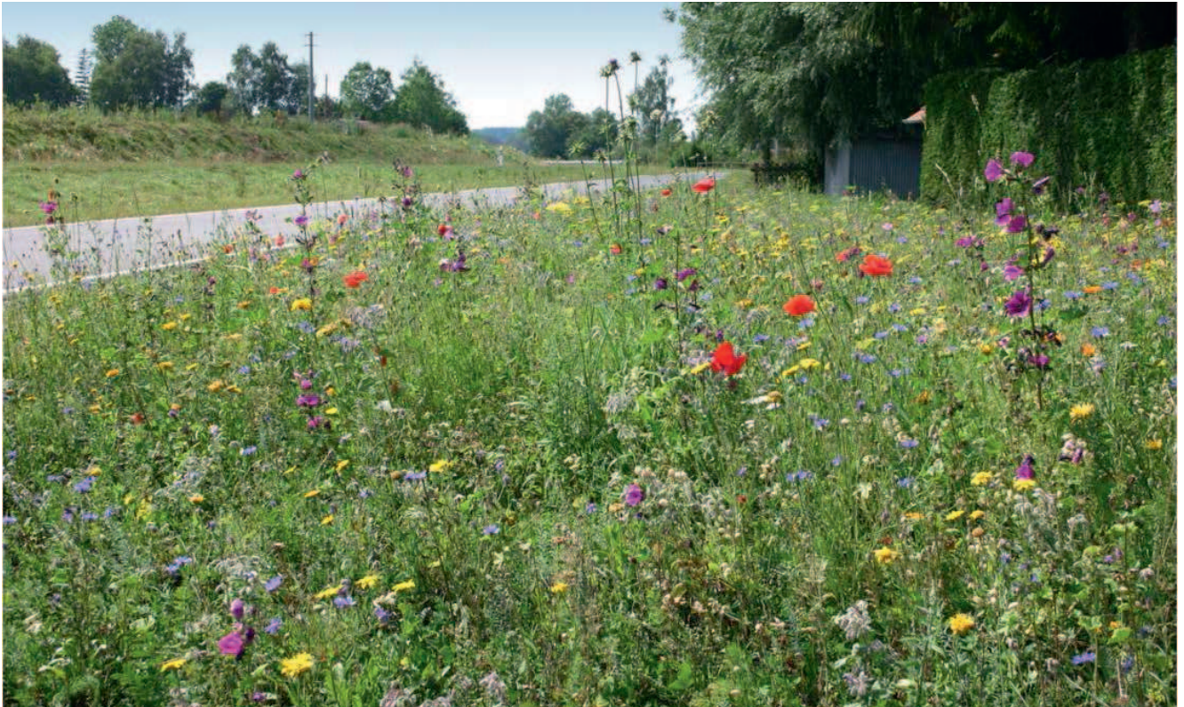
Blumenwiesenmischung in Bad Saulgau (Lkr. Sigmaringen)

Eine weitere Möglichkeit zur Ansaat von Blühmischungen stellen Rast- und Parkplätze dar. Durch Tafeln, auf denen die Bedeutung von Blühflächen und Blühstreifen erläutert wird, und durch das Aufstellen künstlicher Nisthilfen („Insektenhaus“) könnte anschaulich auf die ökologische und ökonomische Bedeutung von Blütenbesuchern und aller sonstigen Tierarten, die von Blühflächen und -streifen profitieren, aufmerksam gemacht werden.