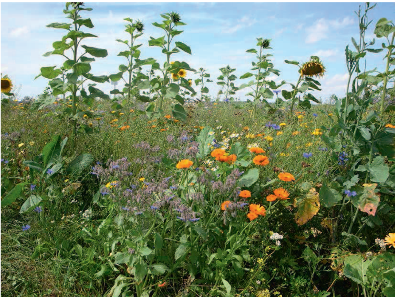
Mehrjährige Blühmischung („Blühende Landschaft mehrjährig Süd“) im ersten Jahr

Grund für eventuell auftretende Beschwerden ist die etwas „spezielle“ Ästhetik, die mehrjährige Blühflächen, vor allem im Winter, auszeichnet. Wie bereits erwähnt, werden solche Flächen unter Umständen über mehrere Jahre nicht gepflegt und bleiben die komplette Zeit über stehen. Im Frühjahr und Sommer der ersten Jahre erscheinen sie vielfältig und farbenfroh, da immer irgendwelche Arten blühen.