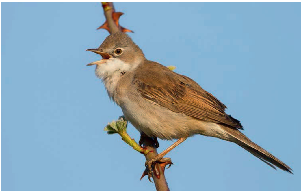
Abgestorbene Pflanzen aus dem Vorjahr stellen für die Dorngrasmücke während der Brutzeit wichtige Lebensräume dar.

Wird der Konkurrenzdruck auf die angesäten Arten durch starke Verunkrautung zu groß, müssen die Blühflächen und Blühstreifen gemäht oder gemulcht werden. Bei starker Verunkrautung am Boden ist ein Schröpfschnitt ca. acht Wochen nach Auflaufen der Saat zu empfehlen. Vor allem in der Etablierungsphase (erstes Jahr nach der Ansaat) können solche Maßnahmen notwendig sein. Dabei ist zu beachten, dass nicht zu tief gemäht bzw. gemulcht wird, um die Jungpflanzen der Blümmischung nicht zu schädigen. Als Richtwert gilt eine Höhe von mindestens 15 cm. Die mechanische Unkrautbekämpfung sollte nicht großflächig, sondern abschnitts- bzw. streifenweise durchgeführt werden.