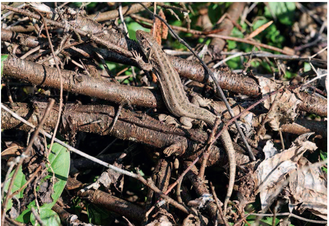
Weibliche Zauneidechse sonnt sich in einem Asthaufen

Einen ähnlich positiven Effekt wie die Anlage von Holzhaufen hat das Liegenlassen von nicht zu feinem Schnittgut aus Gehölzpflegemaßnahmen. Auch dieses verrottet und bietet einer Vielzahl von Tier- und Pflanzenarten einen Lebensraum, auch wenn bei dieser Maßnahme im Allgemeinen weniger strukturierte Sonderstandorte entstehen. Des Weiteren können ganze Bäume, die etwa im Zuge einer Auslichtung von Gehölzflächen entlang von Straßen entnommen werden, auf der Fläche verbleiben. Gleiches gilt für Einzelgehölze, die aufgrund verkehrssicherheitstechnischer Gründe gefällt werden mussten. Hier muss darauf geachtet werden, dass die Verkehrssicherheit nicht beeinträchtigt wird.