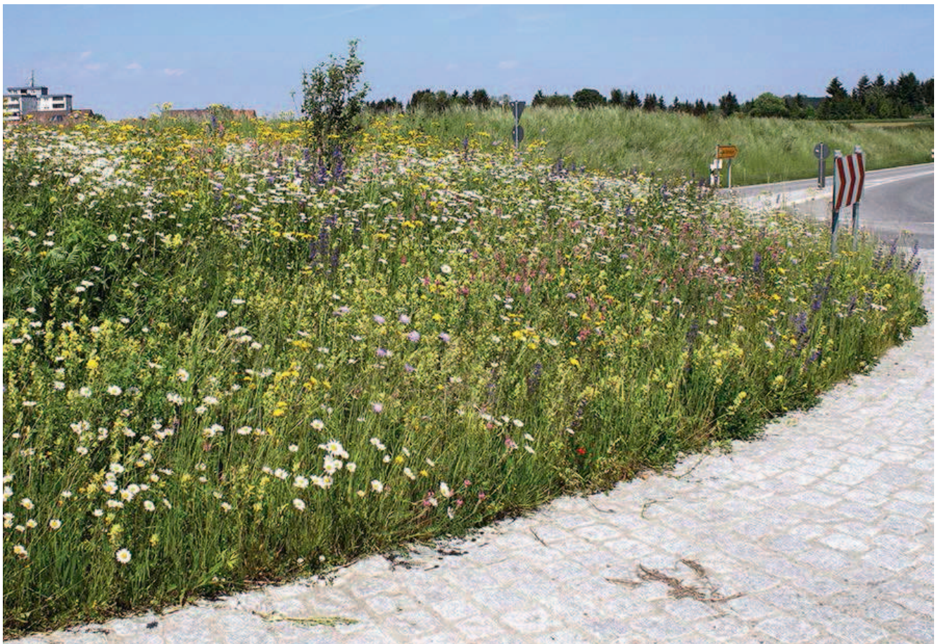
Blühfläche auf einer Verkehrsinsel bei Bad Saulgau (Lkr. Sigmaringen)

In Regionen mit intensiver Landnutzung ist der ökologische Effekt von Blühflächen und Blühstreifen größer als in Regionen mit extensiver Landnutzung, in denen Tieren und Pflanzen eine größere Vielfalt an Lebensräumen zur Verfügung steht. Als mögliche Standorte zur Ansaat von Blühflächen und -streifen entlang von Straßen können praktisch alle Flächen außerhalb des Intensivbereichs – wie etwa Böschungen, Verkehrsinseln oder Anschlussohren – dienen. Besonders geeignet sind sonnige Standorte, da durch zu starke Beschattung die Entwicklung der Pflanzen behindert werden kann. Die Breite von Blühflächen und -streifen sollte fünf Meter nicht unterschreiten. Je breiter sie angelegt werden, desto mehr Lebensraum bieten sie. Bei der Auswahl des Standorts muss zudem beachtet werden, dass dieser zur Reduktion der anfallenden Unterhaltungskosten maschinell gepflegt werden kann. Aus naturschutzfachlicher Sicht besonders interessant ist die Ansaat auf mageren Standorten, da die für diese Flächen verwendeten Saatmischungen in der Regel auch seltenere, eher konkurrenzschwache Arten enthalten. Diese wiederum können unter anderem Insektenarten als Nahrungsquelle dienen, deren Spektrum auf wenige Pflanzenarten eingeschränkt ist. Außerdem kommen auf mageren Standorten weniger Unkräuter vor, die eine erfolgreiche Entwicklung von Blühflächen – vor allem in der sensiblen Etablierungsphase – beeinträchtigen könnten.