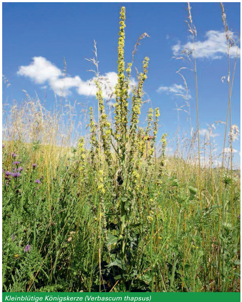
Kleinblütige Königskerze ( Verbascum thapsus )

Unterschieden wird zwischen ein-, über- und mehrjährigen Blühmischungen. Als ökologisch besonders wertvoll haben sich Ansaaten mit mehrjährigen Saatmischungen erwiesen. Diese sind in der Regel sehr artenreich, um möglichst lange und vielfältige Blühaspekte („Trachtfließband“) zu gewährleisten. Zumeist enthalten sie einen höheren Anteil an Saatgut von Wildarten, die in den intensiv genutzten Kulturlächen häufig nicht mehr vorkommen. Für Wildbienen – im Allgemeinen für „Spezialisten“ – sind solche Wildarten besonders wichtig, da sich ihre Mundwerkzeuge über Jahrmillionen an diese angepasst haben. Mehrjährige Blühmischungen können bei günstigen Standorteigenschaften ggf. ohne Pflegemaßnahmen über mehrere Jahre stehen bleiben. Daher bieten sie vielen Insekten und anderen Tieren, die sich dort einfinden, neben einem reichen Nahrungsangebot auch Möglichkeiten zum Überwintern, zum Nestbau oder zur Eiablage. Als Beispiel kann hier die Dreizahn-Mauerbiene ( Osmia tridentata ) genannt werden. Diese Wildbienenart nutzt dürre, markhaltige Stängel, etwa der Königskerze ( Verbascum spec. ), um darin ihr Nest zu bauen und ihre Eier abzulegen.