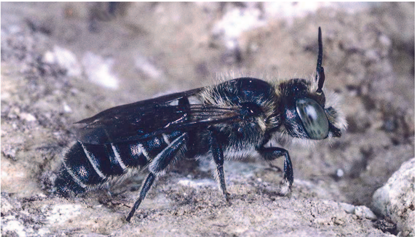
Die auf den Gewöhnlichen Natternkopf angewiesene Natternkopf-Mauerbiene

Ein großes Problem für einige Insektenarten stellt zudem die kurze Zeitspanne dar, in der sie Nahrung aufnehmen können bzw. in der ihnen ihre Wirtspflanze zur Verfügung steht. Verschwindet diese – beispielsweise durch großflächige, frühzeitige Mahd – besteht für sie keine Möglichkeit, genug Nahrung zum Überleben zu finden. Dies kann zu großen Verlusten führen. Eine Möglichkeit, die Lebensbedingungen zu verbessern, stellt die Ansaat von Blühflächen und Blühstreifen dar. Sie dienen der Förderung des Blütenangebots und bieten außerdem einer Vielzahl von Käfern, Wanzen, Fliegen und Spinnen einen Lebensraum. Diese wiederum stehen Vögeln und anderen insektenfressenden Tierarten als Nahrungsquelle zur Verfügung. Zudem profitieren Vögel vom reichlichen Angebot an Pflanzensamen. Auch können Blühflächen und Blühstreifen – bei entsprechender Anbindung und Abmessung – einen Beitrag zum Biotopverbund leisten und der Nützlingsförderung dienen.