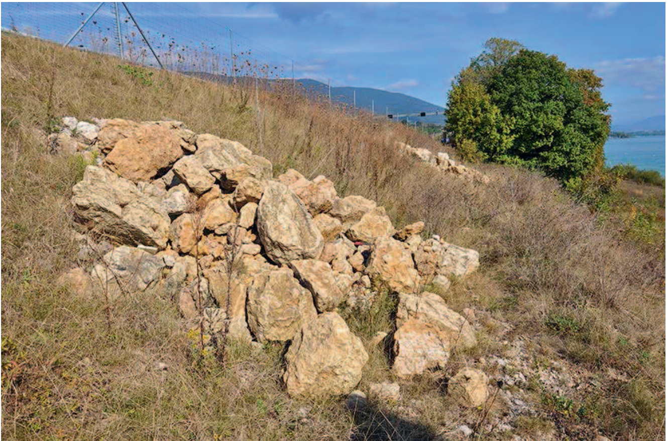
Neu angelegter Steinhaufen entlang einer Autobahnböschung in der Schweiz

Der Unterhaltsaufwand solcher Kleinstrukturen ist im Allgemeinen sehr gering. Zu beachten ist, dass aufkommendes Gebüsch nach Bedarf entfernt wird.