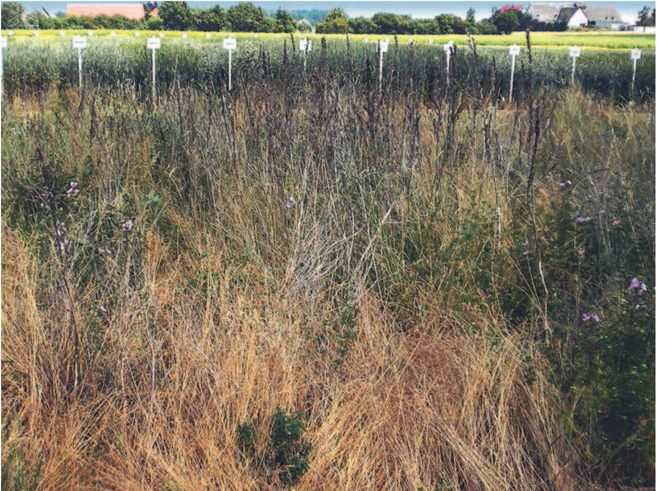
Mehrfährige Blühmischung („Veitshöchheimer Bienenweide“) im vierten Jahr

Im Winter jedoch sieht dies anders aus. Nachdem die letzten Pflanzen verblüht sind, bleiben vertrocknete, dürre Stängel stehen. Aus ökologischer Sicht sind diese sehr wertvoll, da sie einer Vielzahl von Tieren als Nahrung sowie Nist- und Unterschlupfmöglichkeit dienen.