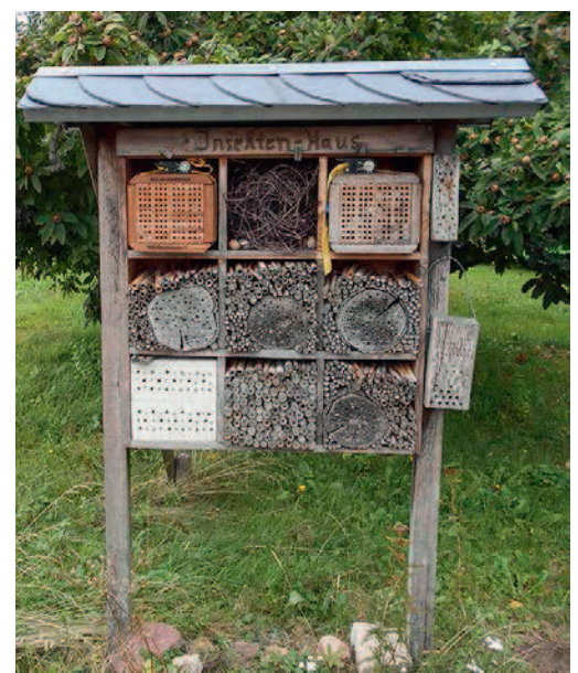
Insektenhäuser wie dieses bieten einer Vielzahl von Insektenarten einen künstlichen Nistplatz

Bei der Ansaat von Blühflächen und Blühstreifen sollte darauf geachtet werden, dass das Saatbett feinkrümelig-locker vorbereitet und nicht klumpig ist. Für den Erfolg einer Ansaat ist die Saatbettbereitung besonders wichtig. Wird dieser nicht genug Aufmerksamkeit geschenkt, können in der Folge Probleme mit unerwünschten Unkrautarten auftreten. So werden weniger konkurrenzstarke Arten der Blühmischung rasch von Unkräutern überwuchert und können sich nicht etablieren. Des Weiteren erfordern stark verunkrautete Flächen entsprechende Gegenmaßnahmen, bevor ein Bestand etabliert werden kann. Treten z. B. „Problemunkräuter“, wie etwa die Ackerwinde ( Convolvulus arvensis ) oder besonders konkurrenzstarke Neophyten (= Pflanzenarten, die sich in Gebieten ansiedeln, in denen sie zuvor nicht heimisch waren) auf, so kann dies ggf. dazu führen, dass zunächst von einer Ansaat von Blühmischungen abzusehen ist, bis die „störenden“ Arten von der Fläche verdrängt sind. Da hierbei von einem Herbizideinsatz abzusehen ist, sollten „scho-nende“ Alternativen zum Einsatz kommen. Grundsätzlich könnte dies