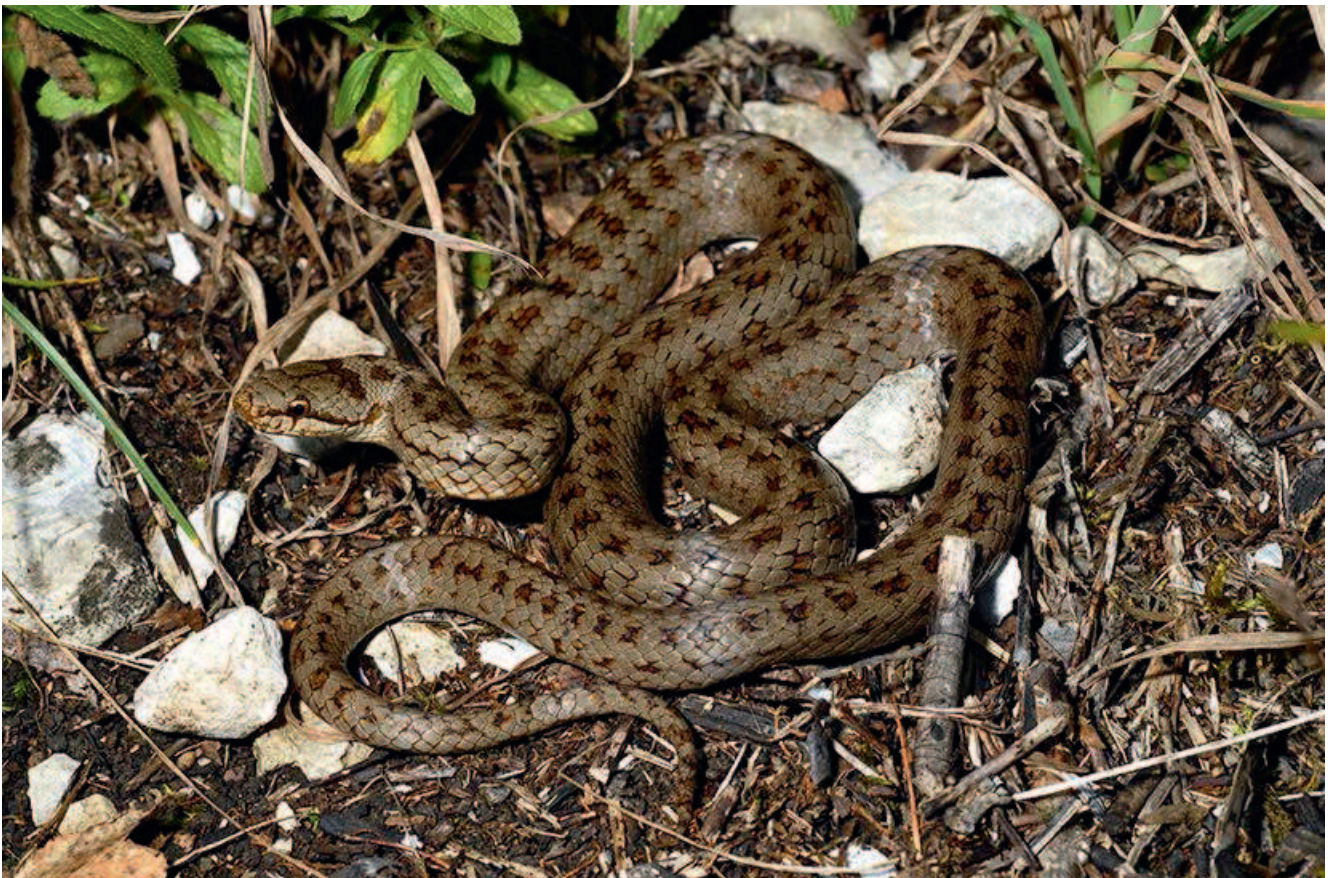
Schlingnatter ( Coronella austriaca )

Zur Erhöhung der Artenvielfalt entlang von Straßen können Steinhaufen und Steinwälle etwa im Zuge von Straßenbaumaßnahmen zum Beispiel auf Straßenböschungen angelegt werden. Besonders geeignet sind dabei fahrbahnabgewandte, sonnenexponierte, windgeschützte Standorte, die ausreichend weit (>10 m, besser >20 m) von der Fahrbahn entfernt sind. Im Idealfall bestehen in der Umgebung bereits entsprechende Strukturen. Wenn möglich, sollten gruppenartig mehrere größere und kleinere Haufen oder Wälle geschichtet werden, die nicht mehr als 20–30 m auseinander liegen. Durchaus sinnvoll ist es auch, bereits strukturreiche Flächen mit Steinhaufen oder -wällen zu ergänzen.