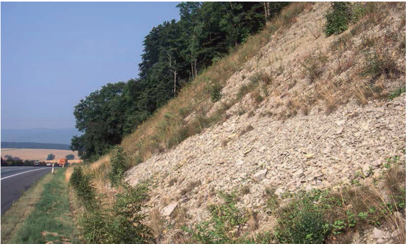
Beispiel für einen künstlich geschaffenen Rohbodenstandort entlang einer Straße

Eine Möglichkeit, die Artenvielfalt entlang von Straßen zu erhöhen, stellt das Schaffen von Rohbodenstandorten dar. Auf solchen nährstoffarmen Standorten kommen in der Regel mehr Pflanzenarten vor als auf nährstoffreichen. Zudem handelt es sich dabei häufig um Arten, die speziell an magere, nährstoffarme Standortverhältnisse angepasst und aus naturschutzfachlicher Sicht besonders wertvoll und interessant sind. Eine Option zur Schaffung von Rohbodenstandorten stellt das Abtragen von nährstoffreichem Oberboden dar, etwa im Zuge von Straßenausbaumaßnahmen. Dabei werden mit schwerem Gerät die obersten Schichten der Böschung entfernt und andernorts wieder eingebaut. Durch die Erhaltung freigelegter Felsbänder, Gesteinsanschnitte und steiler Erdkanten können insbesondere für Kleintiere interessante Sonderstandorte wie z.B. kleinflächige Trockenbiotop entstehen. Bei Neubaumaßnahmen können durch den weitgehenden Verzicht einer Bodenandeckung (max. 5 cm Mächtigkeit) offene Rohboden- und Magerstandorte geschaffen werden. Der zur Andeckung vorgesehene Oberboden sollte in der Nähe seiner Herkunft über entsprechendem Gesteinsuntergrund auf angrenzenden Straßenböschungen mit ähnlichem Entwicklungsziel verteilt werden. Durch die Wiederausbreitung des Oberbodens gelangen viele Sporen und Samen der vorherigen Pflanzendecke auf die Böschungen, was die Entwicklung eines standortgemäßen Vegetationsgefüges erheblich beschleunigen kann.