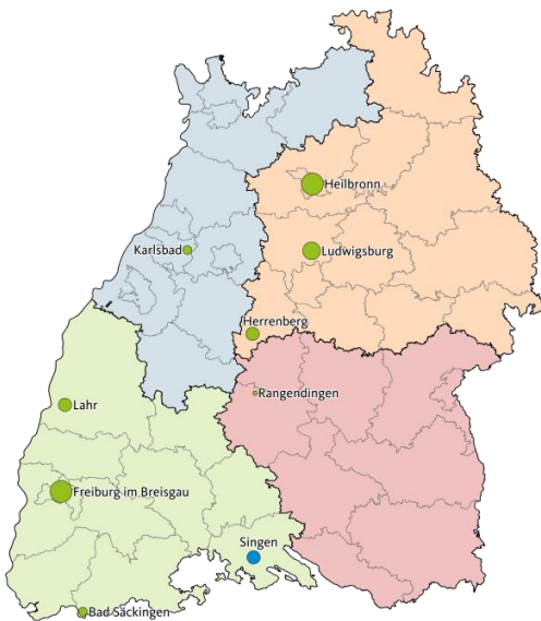
Abbildung 1: Teilnehmende Kommunen