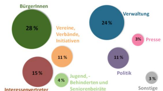
Abbildung 3: TeilnehmerInnen der Veranstaltungen vor Ort